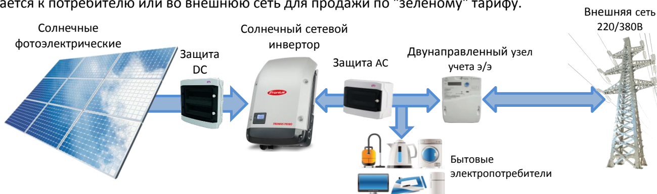
Производительность PV системы

Генерирующая часть состоит из солнечных батарей общей мощностью 7000 Вт. Преобразующая часть – сетевой инвертор выходной мощностью 7 кВт – устройство, которое сбрасывает выработанную панелями электроэнергию во внутримдомовую сеть, откуда она подается к потребителю или во внешнюю сеть для продажи по "зеленому" тарифу.